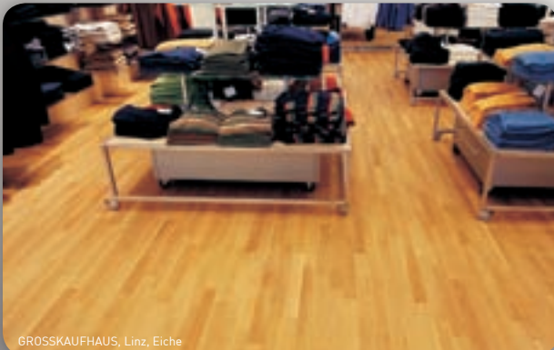
GRÖSSKAUFHAUS, Linz, Eiche

Faktum: Liefergarantie, Pünktlichkeit und Zuverlässigkeit gehören unseren besonderen Stärken. Damit senken wir die Ausfallzeiten auf ein Minimum.