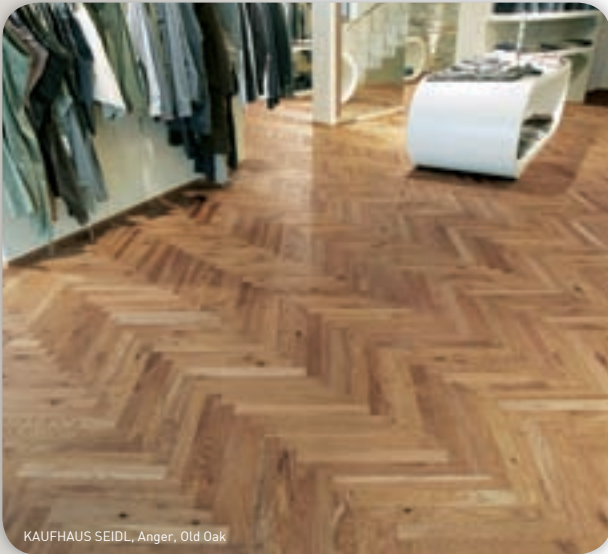
KAUFHAUS SEIDL, Anger, Old Oak

Faktum: Die 7-fache Lackversiegelung schützt den Parkett vor Kratzern und Schädigungen. Außerdem sind Produkte von Weitzer Parkett dank ihrer dickeren Massivholz-Nutzschicht mehrfach renovierbar.