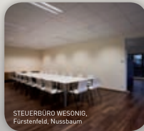
STEUERBÜRO WESONIG, Fürstenfeld, Nussbaum