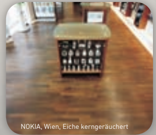
NOKIA, Wien, Eiche kerngeräuchert