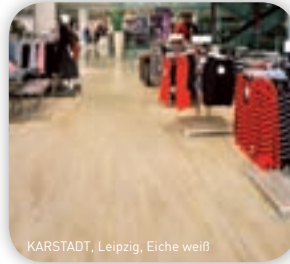
KARSTADT, Leipzig, Eiche weiß

Faktum: Eine enorme Auswahl an exklusiven, zeitgemäßen Farben und Designs eröffnet alle Möglichkeiten einer kreativen, individuellen Shop-Gestaltung.