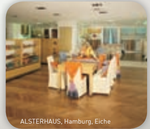
ALSTERHAUS, Hamburg, Eiche